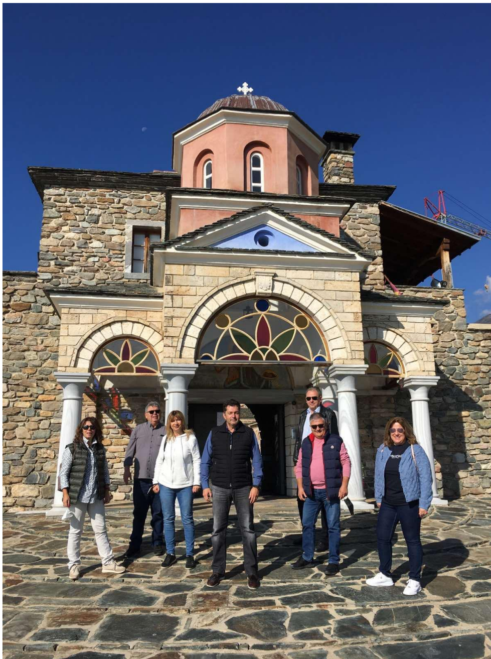
Ιερά Μονή του Τιμίου Προδρόμου