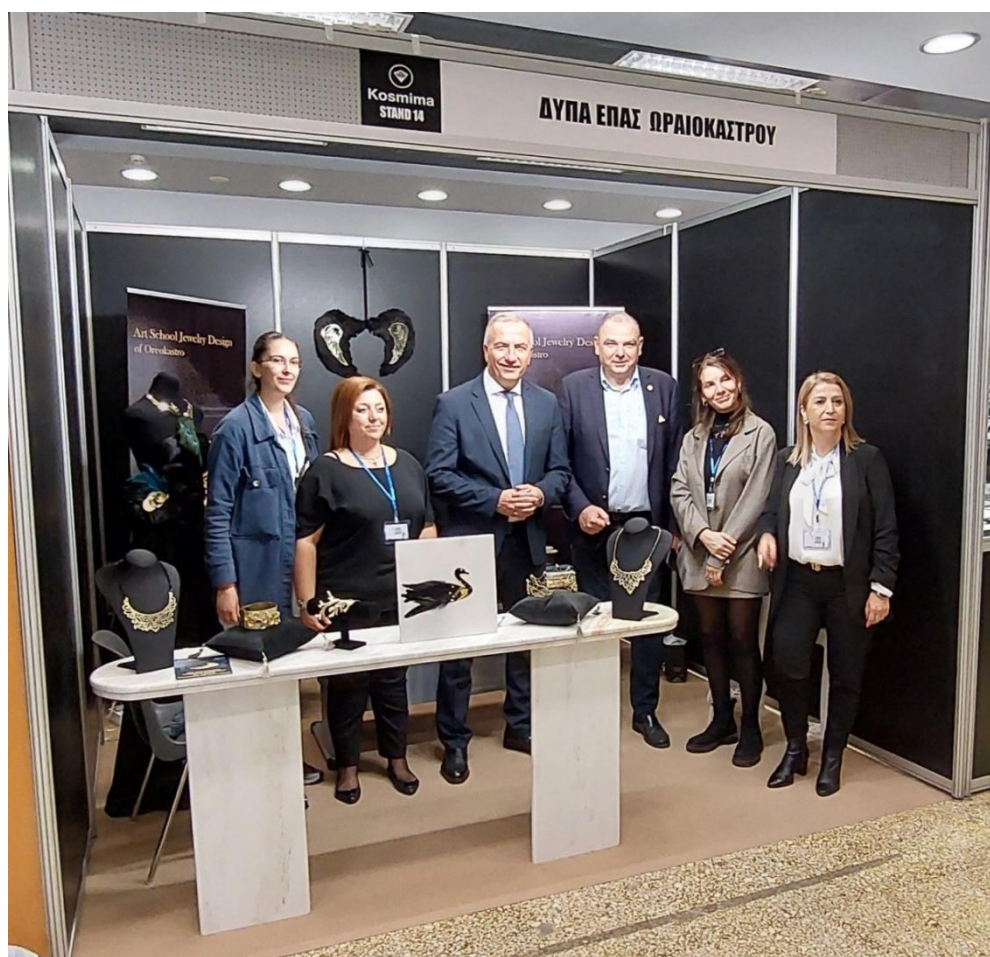
Επίσκεψη του Υφυπουργού Μακεδονίας-Θράκης κ. Σταύρου Καλαφάτη και του Πρόεδρου της ΠΟΒΑΚΩ κ. Πέτρο Καλπακίδη στο stand του τμήματος αργυροχρυσοχοίας της ΕΠΑΣ Ωραιοκάστρου