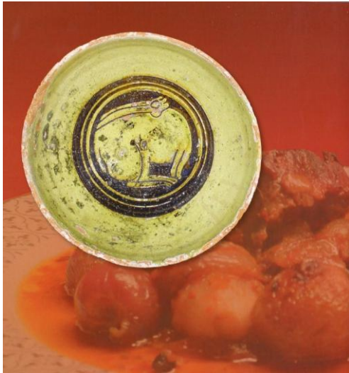
Κρασάτο λαγομαγείρεμα, στιφάδο

Εντύπωση προκαλεί επίσης το γεγονός, ότι ο σύγχρονος αναγνώστης θα βρει αρκετές ομοιότητες μεταξύ της βυζαντινής και της νεοελληνικής κουζίνας.