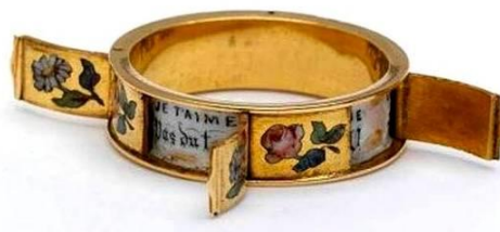
«Je t'aime», «Σ' αγαπώ», 1830

Στη συνείδηση των ανθρώπων, ο Μεσαίωνας έχει παγιωθεί ως μια χρονική περίοδος, η οποία καλύπτει δέκα αιώνες γεγονότων με κύρια χαρακτηριστικά του, να θεωρούνται η οπισθοδρόμηση, η άνθιση του φανατισμού ιδιαίτερα του θρησκευτικού, η στασιμότητα και η αύξηση των δεισιδαιμονιών. Στη συγκεκριμένη εποχή διακρίνεται η εδραίωση της παντοδυναμίας της Ρωμαιοκαθολικής Εκκλησίας σ' όλες τις πτυχές της ζωής των ανθρώπων εφόσον ήταν η μόνη σταθερή δομή σε έναν κόσμο χάωδη που συνεχώς μεταβάλλονταν.