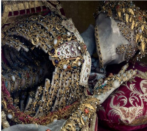
Ο άγιος Υάκινθος στο Gutenzell της Γερμανίας

Με εντολή του Πάπα η αποστολή των αγίων από την Ρώμη, ξεκίνησε τον 17 ο αι. και κορυφώθηκε τον 18 ο αι.