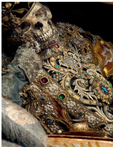
Ο άγιος Βαλεντίνος στην Βασιλική του Waldsassen της Γερμανίας

Για να τους τιμήσουν τους στόλιζαν με κοσμήματα και πολύτιμους λίθους ανυπολόγιστης αξίας. Τα κοσμήματα αυτά συνήθως αποτελούσαν τάματα και προσφορές των πιστών, ως αντίδωρο κάποιας ευεργεσίας.