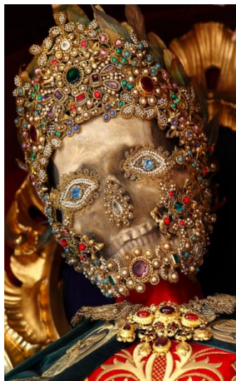
Ο άγιος Φήλικας στο Garsamlinn της Γερμανίας

του Παναγιώτη Καμπάνη, Δρ. Αρχαιολόγος - Ιστορικός, Μουσείο Βυζαντινού Πολιτισμού