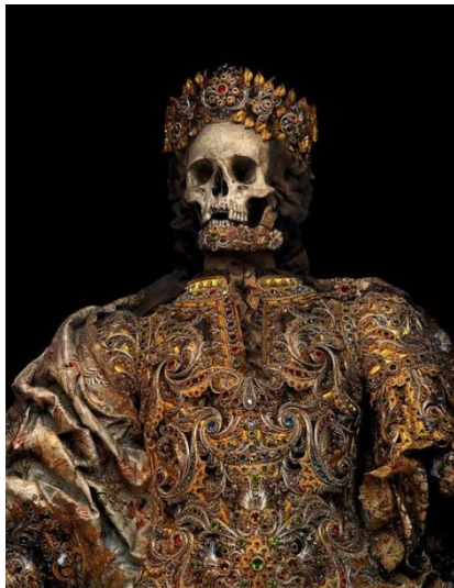
Ο Μάρτυρας Βικτώριος

Στη χριστιανική γραμματεία ο όρος «μάρτυς» προσδιορίζει τους ομολογητές της χριστιανικής πίστης, που με τους βασανισμούς και τη θανάτωσή τους, «μαρτυρούσαν» δηλ. ομολογούσαν την πίστη τους στον Χριστό, ευαγγελιζόμενοι τη νέα εσχατολογική κατάσταση στην οποία εισήλθε ο κόσμος με την έλευση του Κυρίου και την εγκαθίδρυση της Εκκλησίας του. Όπως πολλά στοιχεία του Χριστιανισμού θεωρούνται συνέχεια του παγανιστικού κόσμου, έτσι και το φαινόμενο της λατρείας των ιερών λειψάνων των αγίων, αποτελεί μετασχηματισμό της απόδοσης λατρείας των νεκρών ηρώων από τους εθνικούς. Η λατρεία των λειψάνων βασίζεται στην πίστη ότι μέσα στους ήρωες, τους προφήτες, τους μεσσίες και τους αγίους, δρα μια ιδιαίτερη δύναμη, η οποία παραμένει ενεργή και μετά το θάνατό τους.