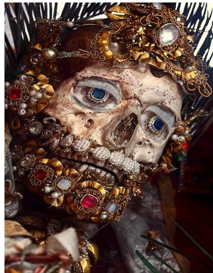
Ο άγιος Βαλέριος στο Weyarn της Γερμανία

Οι ορθόδοξοι Χριστιανοί, οι οποίοι για την προστασία τους χρειαζόταν έστω και ένα μικρό λείψανο από οστά αγίων, συνήθιζαν να τεμαχίζουν τα άγια σκηνώματα και να τα διαθέτουν μέσα σε χρυσοποίκιλτες λειψανοθήκες σε ναούς και μονές όλης της επικράτειας. Σε αντίθεση οι καθολικοί για να δηλώσουν για πολλοστή φορά την υπεροχή τους, προτιμούσαν τους ολόκληρους αγίους. Το αποτέλεσμα ήταν να «εμφανιστούν» πολλοί άγιοι με το ίδιο όνομα. Τρόπο τινά αυτό γινόταν εφικτό, μιας και χρησιμοποιούσαν «αυθεντικά» οστά μαζί με οστά άλλων ανθρώπινων σκελετών και κατασκευασμένων τμημάτων. Το «καλύτερο» λείψανο αγίου ήταν αυτό που διέθετε το κεφάλι.