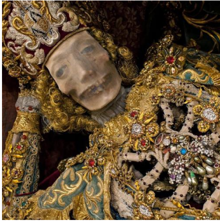
Ο άγιος Κορωνάτος στο Heiligkreuztal της Γερμανίας

Οι στάσεις που έδιναν στους σκελετούς, προσπαθούσαν να είναι όσο πιο φυσικές γινόταν, έτσι ώστε να μοιάζουν με ζωντανούς. Στα χέρια τους συνήθως κρατούν ένα σπαθί, σύμβολο νίκης των μαρτύρων ή ένα γυάλινο διακοσμημένο αγγείο με το αίμα του μάρτυρα. Κάπως έτσι υποτίθεται πως ταυτίστηκαν κιόλας. Στις κατακόμβες μαζί με τους σκελετούς υπήρχαν ληκύθια με αίμα και το όνομα του αγίου. Η νεότερη έρευνα όμως έδειξε πως πρόκειται για ίζημα κρασιού, μάλλον Θείας Κοινωνίας. Λόγω του σπαθιού που κρατούσαν οι Άγιοι ονομάστηκαν Miles Christi, δηλαδή Στρατιώτες του Χριστού, εννοείται εναντίον του προτεσταντισμού.