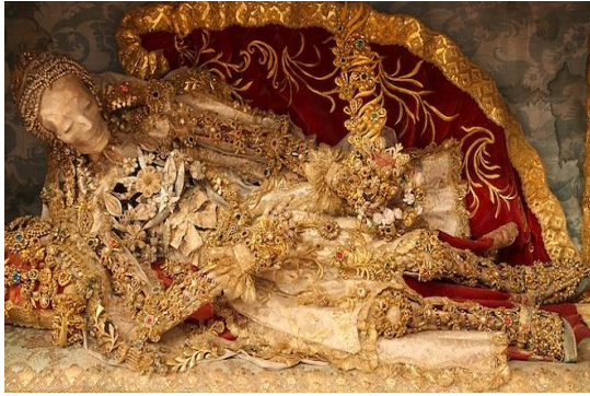
Η αγία Λουκία στο Heiligkreuztal της Γερμανίας

Στα 1763 ο πρώτος σκελετός που ταυτίστηκε, στολίστηκε και είδε το φως της δημοσιότητας, ήταν αυτός του αγίου Αλβέρτου, που έφθασε από την Ρώμη στην εκκλησία του αγίου Γεωργίου στο Burgrain της Γερμανίας. Τον στολισμό ανέλαβε η μοναχή Potentiana Hämmerl από το Friesing. Χρησιμοποίησε κόκκινους και μπλε λίθους, μαργαριτάρια, χρυσό σε φιλιγκράν.