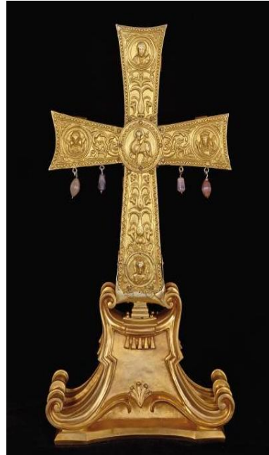
Crux Vaticana, ο Σταυρός του Ιουστίνου Β΄

Ο Βατικάνειος Σταυρός, όπως είναι γνωστός στη σύγχρονη βιβλιογραφία, αποτελεί δώρο του βυζαντινού αυτοκράτορα Ιουστίνου Β΄ και της συζύγου του Σοφίας, μέσω του Πάπα Ιωάννη Γ΄ στο λαό της Ρώμης. Αυτό επιβεβαιώνεται από την επιγραφή που αναπτύσσεται στις δυο κεραίες του σταυρού γραμμένη στα ιδιαίτερα λατινικά της Ανατολικής Ρωμαϊκής Αυτοκρατορίας: «Ligno quo Christus humanum subdidit hostem dat Romae Justinus opem et socia decorem», που μεταφράζεται ως: «Με το Ξύλο με το οποίο ο Χριστός νίκησε τον εχθρό του ανθρώπου, ο Ιουστίνος προσφέρει τη βοήθειά του στη Ρώμη ενώ η γυναίκα του προσφέρει τη διακόσμηση».