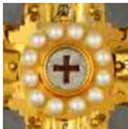
Το Τίμιο Ξύλο σε σχήμα σταυρού

Στην α' όψη του Σταυρού, στο σημείο που ενώνονται οι δύο κεραίες, υπάρχει ένθετο μετάλλιο με τμήμα του Τιμίου Ξύλου. Το μετάλλιο περικλείεται από μικρά μαργαριτάρια. Περιμετρικά οι κεραίες κοσμούνται με πολύτιμους και ημιπολύτιμους λίθους, ενώ στο εσωτερικό τους τρέχει η εγχάρακτη επιγραφή που μνημονεύτηκε παραπάνω: «Ligno quo Christus humanum subdidit hostem dat Romae Justinus opem et socia decorem».