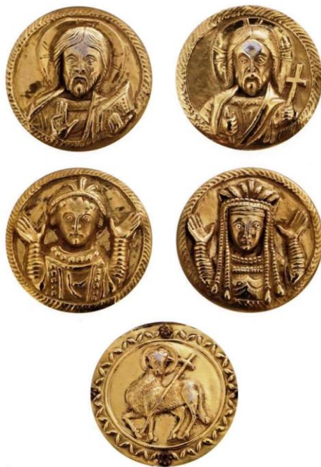
Τα μετάλλια της β' όψης

φέρει την παράσταση του Αμνού του Θεού. Ο αμνός, ό αϊρων τὰς ἁμαρτίας τοῦ κόσμου, που συμβολίζει την «άωμο θυσία» του Χριστού, ενώ κυριάρχησε ως σύμβολο της χριστιανικής εκκλησίας όλη την παλαιοχριστιανική περίοδο, τελικά απαγορεύτηκε από την έν Τρούλλω Οικουμενική Σύνοδο (ή Πενθέκτη) το 692. Τα δυο μετάλλια της κάθετης κεραίας απεικονίζουν τον Χριστό Παντοκράτορα κρατώντας ευαγγέλιο στο επάνω και σταυρό στο κάτω μέρος. Κατά μια άλλη άποψη, η μορφή με το σταυρό ίσως απεικονίζει τον Ιωάννη τον Βαπτιστή. Στα μετάλλια της οριζόντιας κεραίας απεικονίζονται οι δωρητές, ο αυτοκράτορας Ιουστίνος και η Αυγούστα Σοφία. Σε μεταγενέστερους σταυρούς στη θέση αυτή των δωρητών εικονίζονται η Παναγία και ο Ιωάννης ο Ευαγγελιστής. Θλαστή γραμμή σε σχήμα μικρών φύλλων περιτρέχει την περίμετρο του σταυρού, ενώ στα κενά διαστήματα, ανάμεσα στα μετάλλια αναπτύσσεται φυτικός διάκοσμος αποτελούμενος από φοινικόδεντρα και ελίσσόμενους βλαστούς, ο οποίος όμως, όπως έδειξε η σύγχρονη συντήρηση ανήκει μάλλον στον 18 ο αι. Από την οριζόντια κεραία κρέμονται τέσσερα πεντέλια από σταγονόσχημους αχάτες.