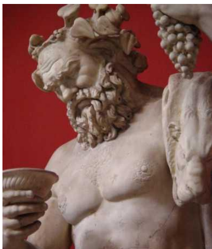
Εικόνα 2: Διόνυσος, ο θεός του κρασιού

Η Άμπελος πιστεύεται ότι εξημερώθηκε περί το 5000-4000 π.Χ., από άγριο είδος στην περιοχή του Καυκάσου, και εξαπλώθηκε Μεσοποταμία και τη Μεσόγειο μέσω του