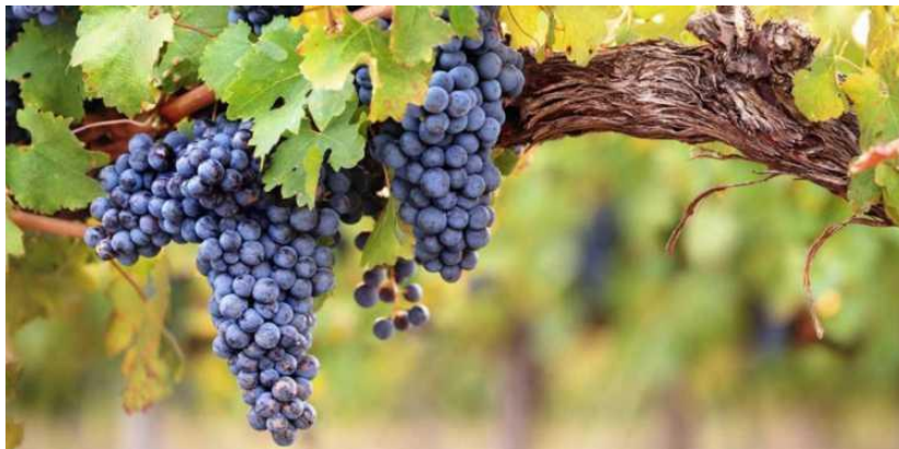
Εικόνα 3: Πρέμνο ερυθρής ποικιλίας

Το αμπέλι αποτελεί από τις πιο δύσκολες και απαιτητικές καλλιέργειες, όχι τόσο σε εισροές (νερό, λίπασμα), όσο σε γνώση και καλλιεργητικές τεχνικές. Το ιδανικό κλίμα για την καλλιέργεια αποτελείται από μακρά, ξηρά και θερμά έως πολύ θερμά καλοκαίρια, σε εναλλαγή με δροσερούς χειμώνες. Ανάλογα με το κλίμα και το έδαφος της περιοχής, φυτεύονται οι αντίστοιχες ποικιλίες που θα ευδοκιμήσουν. Η έννοια του «terroir» περιγράφεται από το Διεθνή Οργανισμό Οίνου και Αμπέλου (OIV) ως ένας τύπος με συγκεκριμένες αλληλεπιδράσεις μιας ποικιλίας με τις υπάρχουσες εδαφοκλιματικές συνθήκες, αλλά και των αμπελοοινικών πρακτικών των καλλιεργητών, έτσι ώστε το προϊόν που παράγεται εκεί χαρακτηρίζεται από αυθεντικότητα και γνησιότητα και συνεπώς αποκτά συγκεκριμένη φήμη. Για παράδειγμα, ακόμα κι αν πάρουμε μια γαλλική ποικιλία που παραδοσιακά καλλιεργείται στο Bordeaux, και τη φέρουμε στην Ελλάδα σε παρόμοιες συνθήκες, ακολουθώντας τις ίδιες τεχνικές καλλιέργειας και οινοποίησης, ποτέ δε θα μπορέσουμε να έχουμε την ίδια ποιότητα προϊόντος με το γνήσιο.