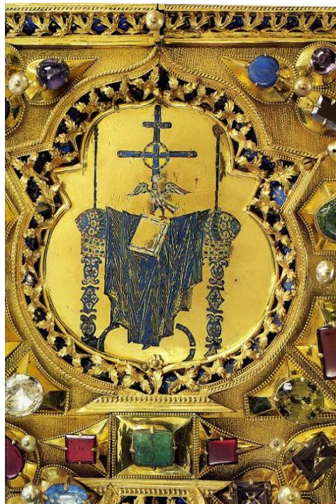
Η «Ετοιμασία του Θρόνου»