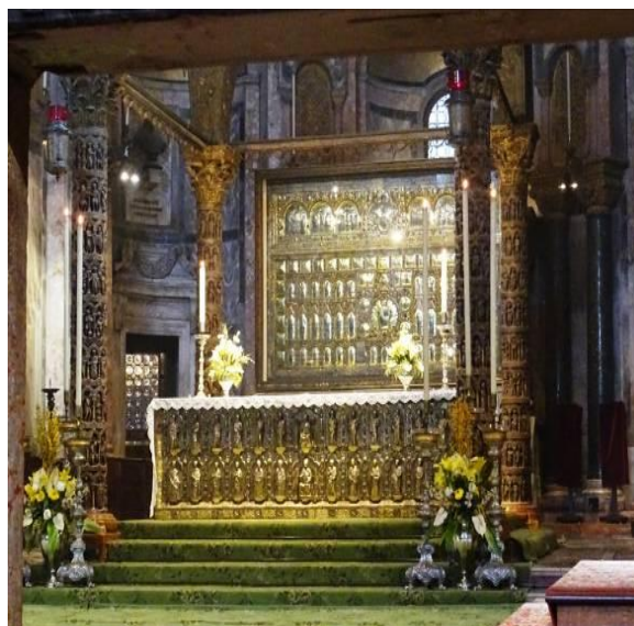
Η Pala d' Oro με το προστατευτικό κάλυμμα