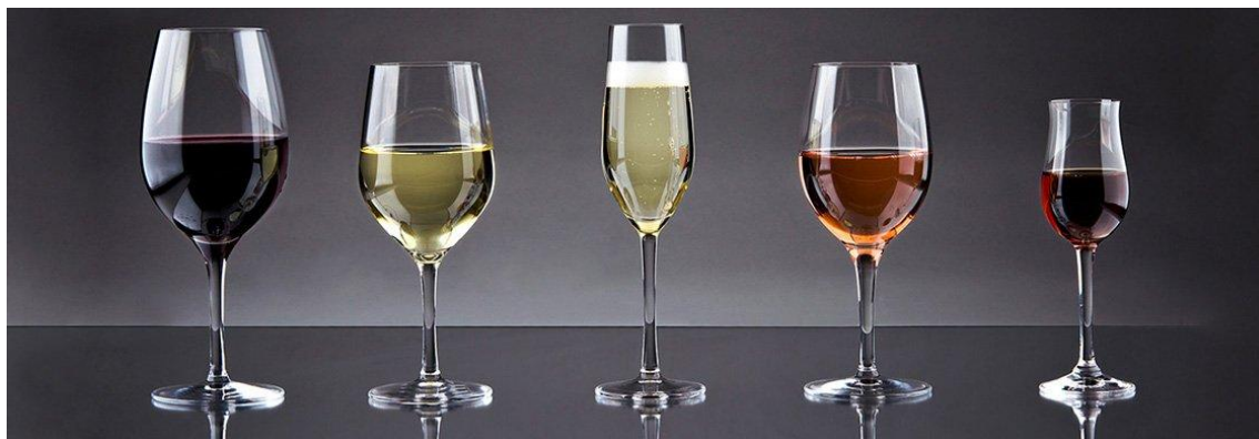
Εικόνα 2: Διάφοροι τύποι οίνου

Ένας δεύτερος διαχωρισμός έχει να κάνει με το πόσο ξηρός ή γλυκός είναι ο οίνος, ανάλογα με την ποσότητα των σακχάρων και των οργανικών οξέων που περιέχει. Κατατάσσονται σε ξηρούς – με λιγότερο από 4g σακχάρων ανά λίτρο –, ημίξηρους, ημίγλυκους και γλυκούς – με περισσότερο από 40g σακχάρων ανά λίτρο. Ιδιαίτερη κατηγορία γλυκών κρασιών αποτελούν οι επιδόρπιοι οίνοι, που μπορούν να περιέχουν έως και 250g σακχάρων ανά λίτρο.