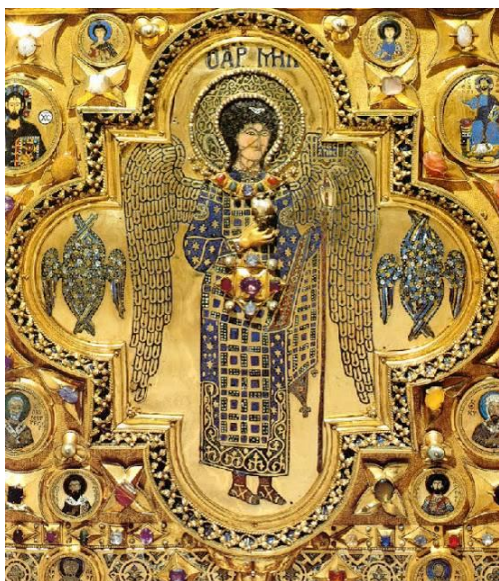
Ο Αρχάγγελος Μιχαήλ